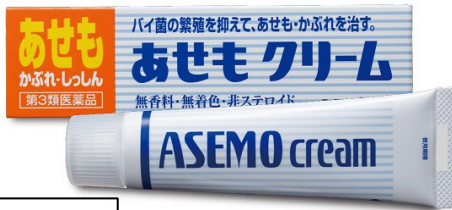
第3類医薬品 販売名：ユースキンN