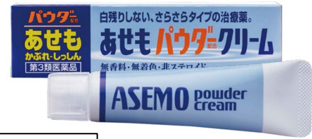
第3類医薬品 販売名：ユースキンNP