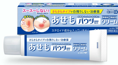
第3類医薬品 販売名：ユースキンNP

※旧デザイン（ユースキンA、ハナ、ユースキン、ユースキンS）も、応募の対象となります。